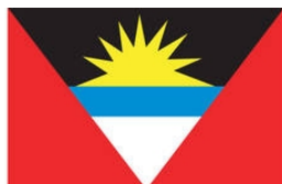
ANTIGUA & BARBUDA