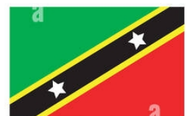
ST. KITTS & NEVIS