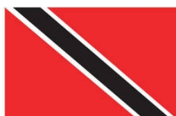
TRINIDAD & TOBAGO