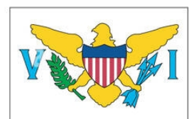
UNITED STATES VIRGIN ISLANDS