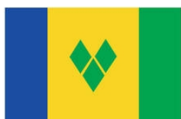
ST. VINCENT & THE GRENADINES